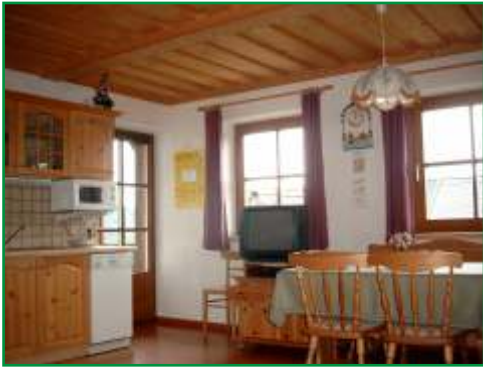
Wohnung 1 (62 m 2 )

Die zwei neuen Ferienwohnungen im Nebenhaus sind mit Küche (E-Herd, Kühlschrank, Geschirr und Geschirrspüler), Schlafzimmer, eigenem Kinderzimmer, Babyausstattung (auch Gitterbett und Kinderwagen), Bettwäsche, SAT-TV, Radio und Balkon ausgestattet.